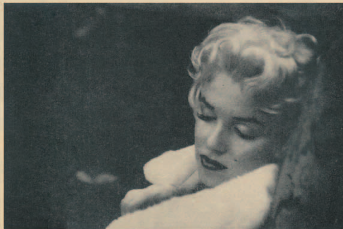
Exhausted Marilyn, too tired to undress, naps briefly in evening gown and furs on return home after a hectic day.