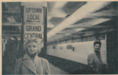
Stylish Marilyn goes practically unnoticed in the New York subway and almost completely disregarded during classes in the Actor's Studio (bottom picture) among experienced actors and young, hopeful drama students.