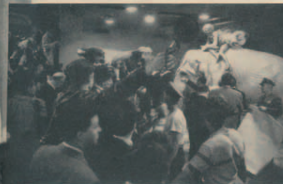
Pensive Marilyn (left) faces a busy day of costume fittings, business conferences, acting classes and public appearances . . . such as riding a pink elephant (above) for the benefit of charity on the opening night of the circus in New York.

No one knows whether or not she can win her fight to be more than a glamorous doll. But one prediction is fairly safe: She will continue to be one of America's most talked-about women for a long time to come.